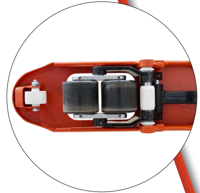
Ein- und Ausfahrrollen