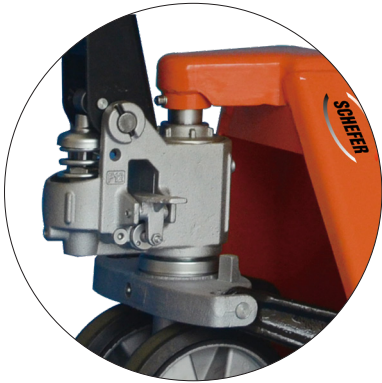
Hochleistungs-Hydraulikpumpe mit Zentralverschluss