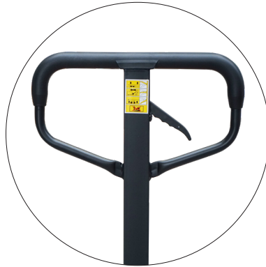
Stabile Deichsel mit Gummi-Kunststoffummantelung