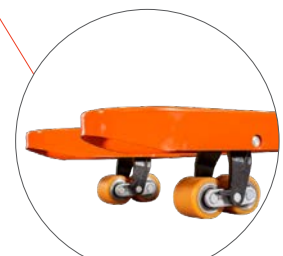
PU Tandem Rollen