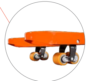
PU Tandem Rollen