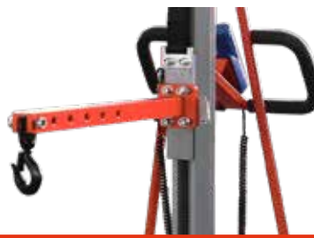
Tragarmausleger Art.Nr.: El-Ausleger L, mm: 510 B, mm: 85 H, mm: 145 (inkl. Haken) Gewicht, kg: 4