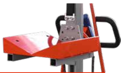
Rollen-Block Art.Nr.: El-Rollenblock L, mm: 410 B, mm: 400 H, mm: 125 Gewicht, kg: 16