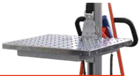
Rollenplattform Edelstahl Art.Nr.: El-Plattform-SS L, mm: 610 B, mm: 480 H, mm: 37 Gewicht, kg: 18