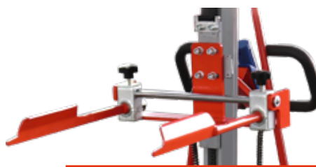
Behälterklammer Art.Nr.: El-Klammer L, mm: 540 B, mm: 450 H, mm: 192 Gewicht, kg: 7