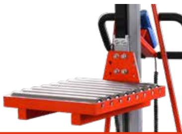
Plattform mit Rollenbahn Art.Nr.: El-Plattform-RB L, mm: 514 B, mm: 418 H, mm: 210 Gewicht, kg: 18