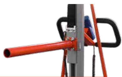
Rollendorn Art.Nr.: El-Rollendorn L, mm: 610 Ø, mm: 50 Gewicht, kg: 3