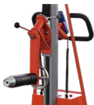
Rollen-Wender Art.Nr.: El-Rollenwender L, mm: 422 B, mm: 80 H, mm: 459 Gewicht, kg: 11