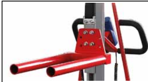
Doppeldorn Art. Nr.: EL-DOPPELDORN

L, mm: 510 B, mm: 260 H, mm: 177 Gewicht, kg: 7