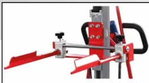
Behälterklammer Art.Nr.: EL-KLAMMER

L, mm: 540 B, mm: 450 H, mm: 192 Gewicht, kg: 7