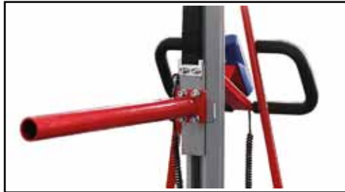
Rollendorn Art. Nr.: EL-ROLLENDORN

L, mm: 610 B, mm: 480 H, mm: 37 Gewicht, kg: 18