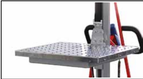
Rollenplattform Edelstahl Art.Nr.: EL-PLATTFORM-SS

L, mm: 610 B, mm: 480 H, mm: 37 Gewicht, kg: 18