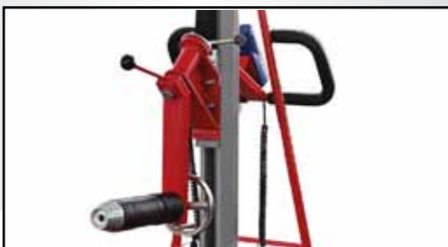
Rollenwender Art.Nr.: EL-ROLLENWENDER

L, mm: 422 B, mm: 80 H, mm: 459 Gewicht, kg: 11