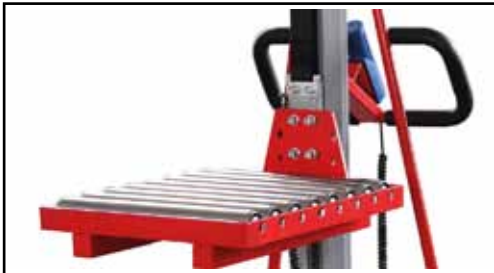
Rollenplattform mit Rollenbahn Art.Nr.: EL-PLATTFORM-RB

L, mm: 514 B, mm: 418 H, mm: 210 Gewicht, kg: 18