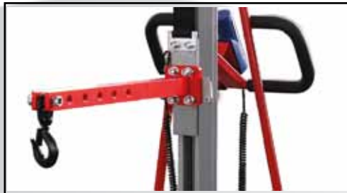
Tragarmausleger Art. Nr.: EL-AUSLEGER

L, mm: 510 B, mm: 85 H, mm: 145 (inkl. Haken) Gewicht, kg: 4