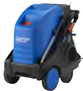
MH 4M X