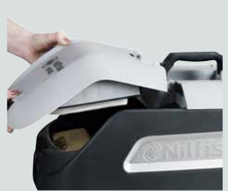
Magnetverschlüsse sorgen für hohe Zuverlässigkeit.