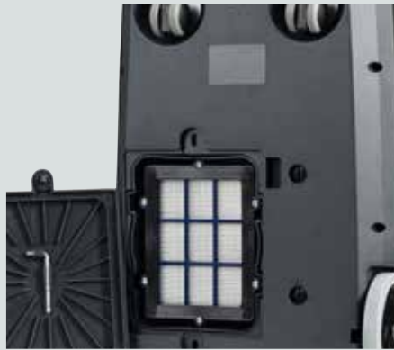
HEPA H13-Abluftfilter ist Standard bei allen Versionen des VP600.