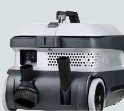
Benutzerfreundliches und leicht erreichbares Zubehör.