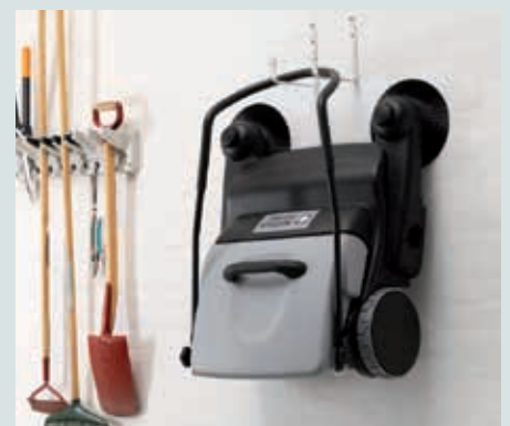
Die intelligente Konstruktion erlaubt eine senkrechte, sogar hängende Lagerung der Maschine, da der Schmutzbehälter durch den umgeklappten Handgriff fixiert wird.