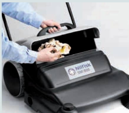
Der Schmutzbehälter kann aufgestellt werden, dies ermöglicht das Entleeren von Abfalleimern und Entsorgen von größeren Gegenständen direkt in den Behälter.