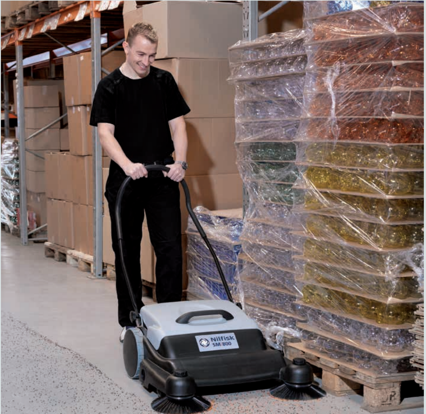
Der Schubbügel kann optimal auf die Größe des Bediener angepasst werden (drei Positionen).