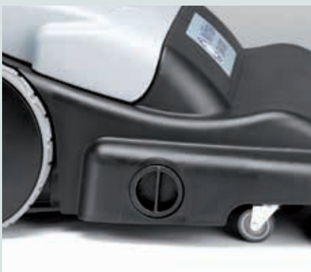
Hauptkehrwalzen einzeln und werkzeuglos in vier unterschiedliche Positionen einstellbar.