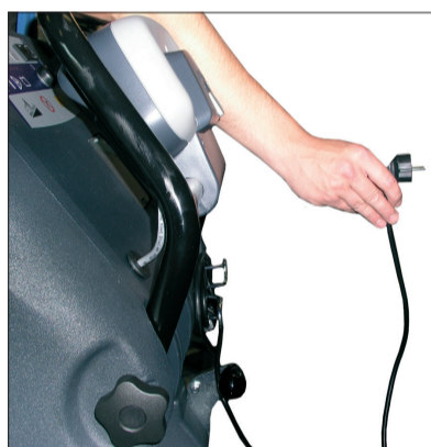
6. Laden der Batterien und überprüfen des Ladegerätes.