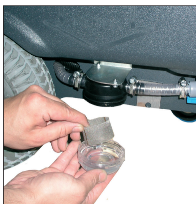
3. Reinigung und Kontrolle des Frischwasserfilters und des Saugschlauches.