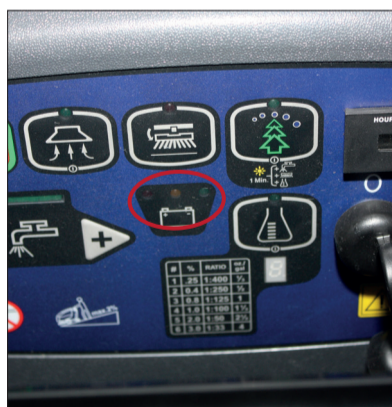
3. Kontrolle des Ladegeräts und Prüfung der Ladekabel.