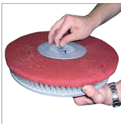
5. Reinigen der Bürsten oder Pads. Bei Verschleiß tauschen.