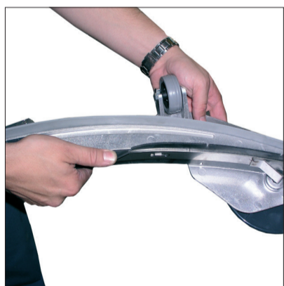
1. Überprüfung der Sauglippen, ggf. Austausch.