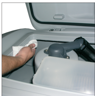
4. Abwassertank Dichtung prüfen und ggf. reinigen.