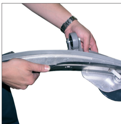
2. Prüfen auf Verunreinigung und Zustand der Absaugleiste und des Gummis.