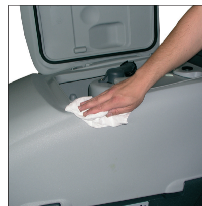
4. Reinigung der Maschine für lange Lebensdauer.