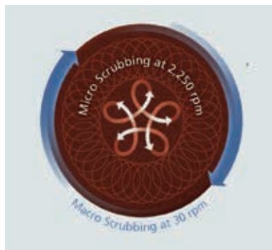
Tiefenwirkung: Rotierende und oszillierende Bewegungen für höchste Reinigungsergebnisse.