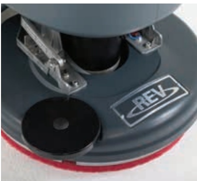
Der vollintegrierte Treibteller ist im Lieferumfang enthalten.