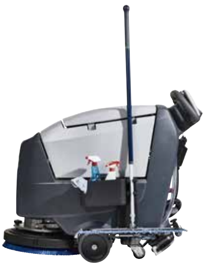
Optionaler Zubehörkorb und Halterung für den Wischmop erhältlich.