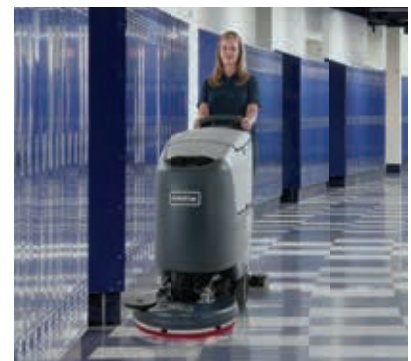
REV: Bessere Ergebnisse, höhere Produktivität und nachhaltige Reinigung.